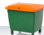
κοντέινερ γενικής χρήσης / κάδος αμμοχάλικου 210 l αξεσουάρ: καπάκι απλό ή αρθρωτό 790 × 605 × 685 / με καπάκι 775 mm στάνταρ αποχρώσεις: ■■■