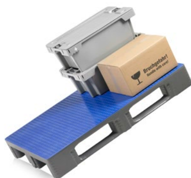
TC1 Palgrip® παλέτα

Οι πλαστικές παλέτες Craemer Palgrip® με την πρωτότυπη αντιολισθητική επίστρωση και τεχνολογία Palgrip® προσφέρουν απaráμιλλη απόδοση για αξιόπιστο χειρισμό και ανάληψη φορτίου. Η αντιολισθητική επίστρωση στην άνω επιφάνεια της παλέτας ή εναλλακτικά στην επιφάνεια κάτω από τις τραβέρσες (πέλματα) των παλετών παρέχει εξαιρετική αντοχή στην ολίσθηση, καθιστώντας την ως ιδανική λύση για οποιαδήποτε τεχνική απαίτηση στον χώρο των Logistics. Σε σύγκριση με τις κοινές λείες πλαστικές επιφάνειες, η αντιολισθητική πρόταση Craemer Palgrip® προσφέρει απόλυτη αντοχή στην ολίσθηση χάρη στη μοναδική δομή κόκκων της. Αυτή η δομή παρέχει αξιόπιστο χειρισμό ακόμη και σε συνθήκες υψηλής υγρασίας ή, πολύ περισσότερο, και σε κεκλιμένη θέση. Η συγκεκριμένη τεχνολογία υποβοηθάει σε εξαιρετικά μεγάλο βαθμό τη χρήση παλετών κατά την περιστροφή τους, στην αποθήκευση σε ψηλά ράφια, καθώς και κατά τη χρήση σε κυλινδρικούς (ράσουλα) ή αλυσιδωτούς ταινιόδορμους.