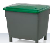
κοντέινερ γενικής χρήσης / κάδος αμμοχάλικου 400 l αξεσουάρ: καπάκι απλό ή αρθρωτό 945 × 725 × 830 / με καπάκι 930 mm στάνταρ αποχρώσεις: ■■■