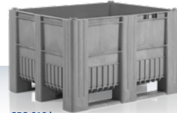
CB3 610 I 1200 × 1000 × 740 mm στάνταρ αποχρώσεις: ■ ■ ■ ■ ■ ■ ■ ■ ■ ■