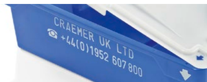
παράδειγμα: γράμματα (εν θερμώ εκτύπωση)