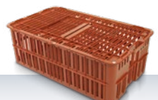
κλούβα μεταφοράς πουλερικών 840 × 495 × 295 mm κατόπι αιτήματος