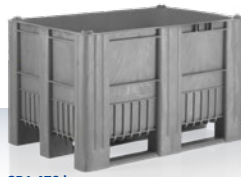
CB1 470 I 1200 × 800 × 740 mm στάνταρ αποχρώσεις: ■ ■ ■ ■ ■ ■ ■ ■ ■ ■