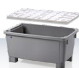
στοιβαζόμενος & εισχωρούμενος κάδος 300 l αξεσουάρ: καπάκι 1200 × 780 × 580 mm