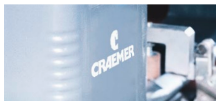
παράδειγμα: λογότυπο (εν θερμώ εκτύπωση)