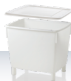
μεγάλος κάδος 400 l αξεσουάρ: καπάκι, τρόλλεϋ 945 × 725 × 830 mm