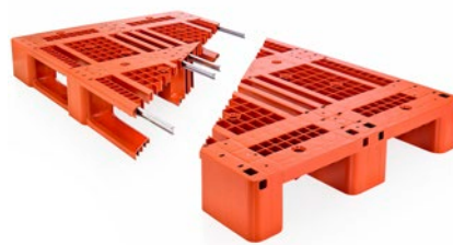
Αναπαράσταση εσωτερικής ενίσχυσης παλετών με ασάλινες ράβδους

Ανάλογα με τη σειρά και τη συγκεκριμένη έκδοση τους, οι πλαστικές παλέτες Craemer μπορούν να εξοπλιστούν με επιπλέον τεχνικά χαρακτηριστικά, όπως μία ποικιλία επιλογών περιμετρικού χείλους προστασίας για αυξημένη ασφάλεια του φορτίου κατά τη μεταφορά και αποθήκευση ή με εσωτερικές ασάλινες ράβδους -ανθεκτικές στη διάβρωση- προς ενίσχυση της φέρουσας ικανότητας αποθήκευσης μεγάλων φορτίων σε ράφι. Οι πλαστικές παλέτες Craemer μπορούν επίσης να εξοπλιστούν με chip RFID για εύκολη και αποτελεσματική παρακολούθηση, ιχνηλάτηση και διαχείριση της πορείας του φορτίου. Επικοινωνήστε με την ομάδα πωλήσεων του Οίκου Craemer για λεπτομερείς ερωτήσεις σχετικά με τη διαθεσιμότητα των παραπάνω δυνατοτήτων στις διάφορες σειρές παλετών.